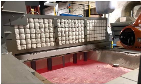
Inmersion Heaters Calentamiento por resistencias sumergidas