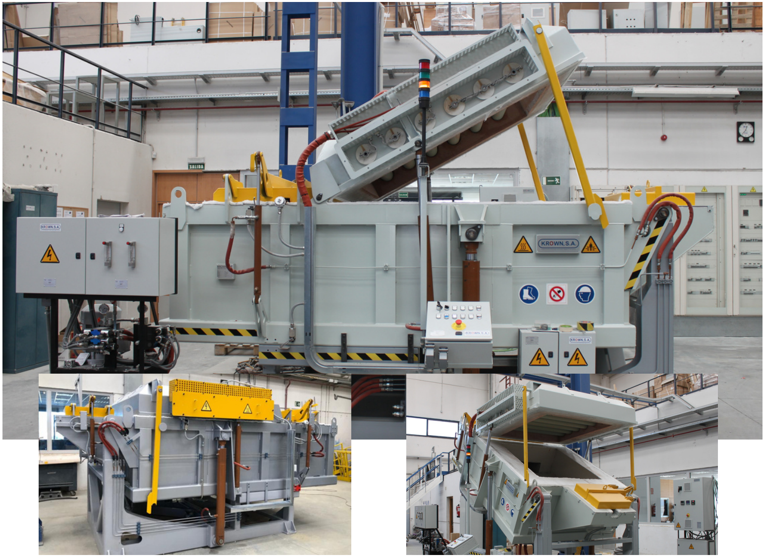
Holding Furnace designed for Structural Parts Horno de Mantenimiento para Piezas Estructurales