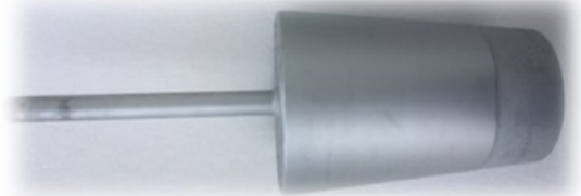
Porous Plugs to increase the density of the alloy. Tapones Porosos instalados para incrementar la densidad de la aleación.